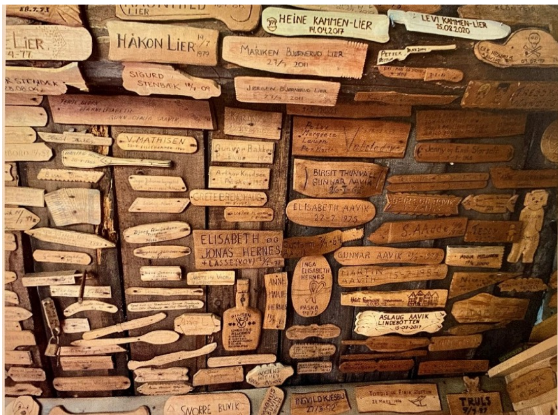
Eksempler på navnstikker som er festet i taket på Østre Øyvollen.