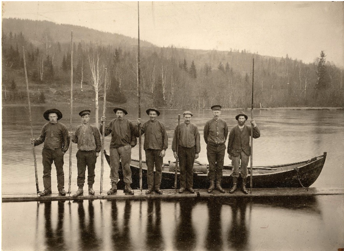
Foto: Tømmerfløtere ved Nustadfossen 1902.