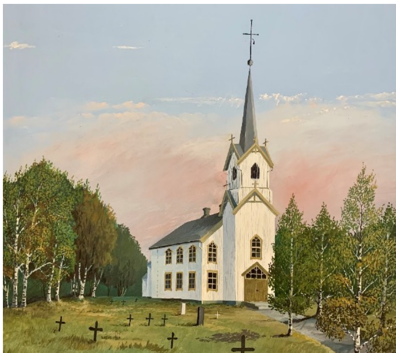
Maleri av Meråker kirke, Harald Løkken 1966.