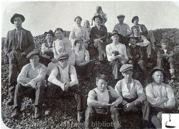
Lillefjell gruve under 1. verdenskrig

Kopperets tid – I elva Kopperåa er det konkrete funn av kopper datert til 1200- og 1300-tallet. Foreløpig er dette landets eldste smelteverket for kopper. Selve gruva har imidlertid ingen klart å finne ennå. De eldste gruvene for utvinning av kopper ble satt i gang i 1747 og 1748. En av Norges rikeste gruver, Lillefjell gruve, ble åpnet i 1760, og den første smeltehytta ved Gilså ble satt i drift i 1770. Ny smeltehytte ble bygget under Nustadfossen ved Meråker sentrum i 1828. Som siste gruve ble Lillefjell stengt i 1920.