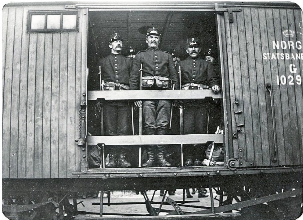
Gudå stasjon 1905, frakting av soldater på Meråkerbanen mellom Teveldalen og Stjørdal

Vi må aldri ta fred og frihet som en selvfølge.